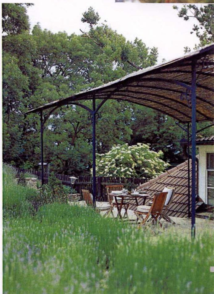
Z domu se do zahrady vstupuje terasou, pro níž Simona sama navrhla přístřešek z bambusových rohoží.