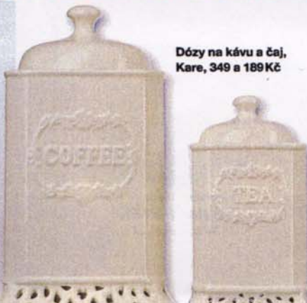
Dózy na kávu a čaj, Kare, 349 a 189 Kč